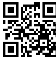
大師輔導與徵選報名 QRcode

(二) 報名時間: 即日起 至 112 年 5 月 1 日(一)17:00 止。